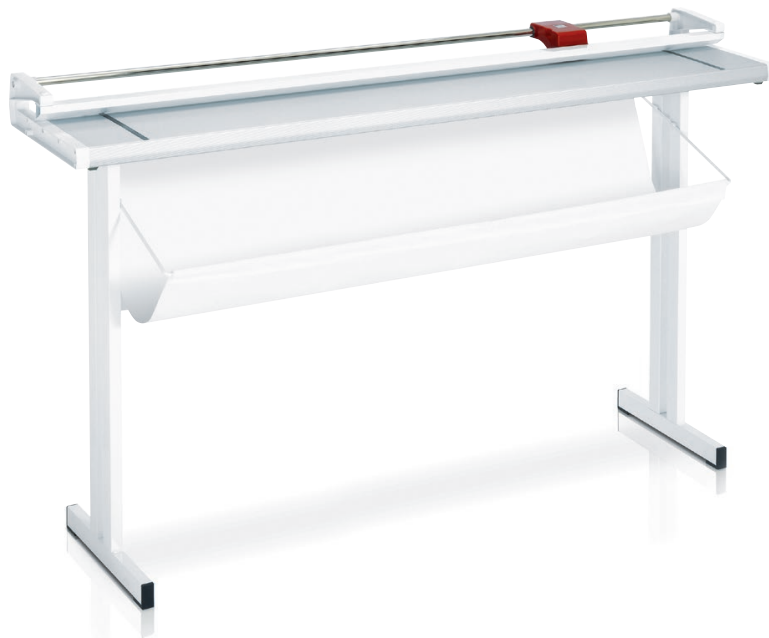
Table en aluminium anodisé