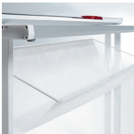
Table graduée en centimètres de chaque côté permettant d'aligner avec exactitude les documents à couper.