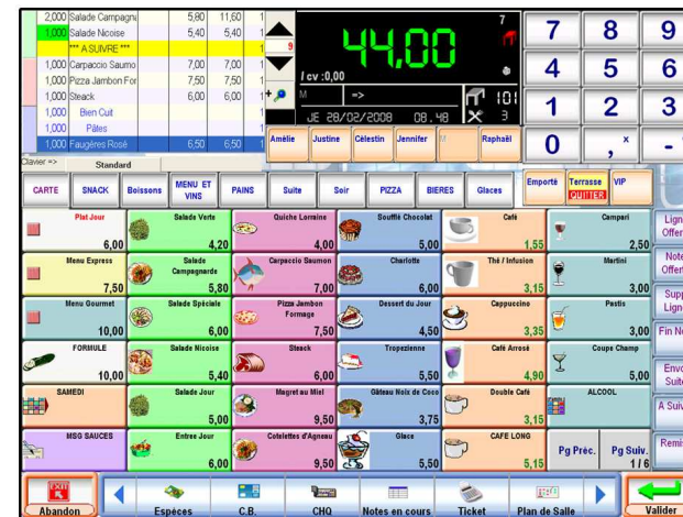
Ecran de caisse