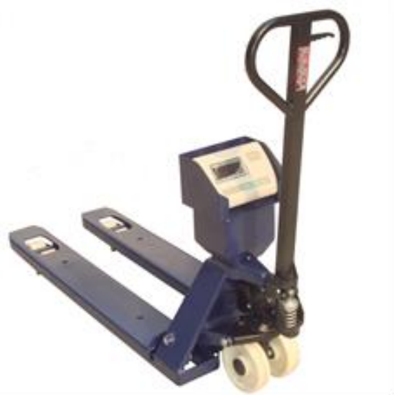
Face avant indicateur